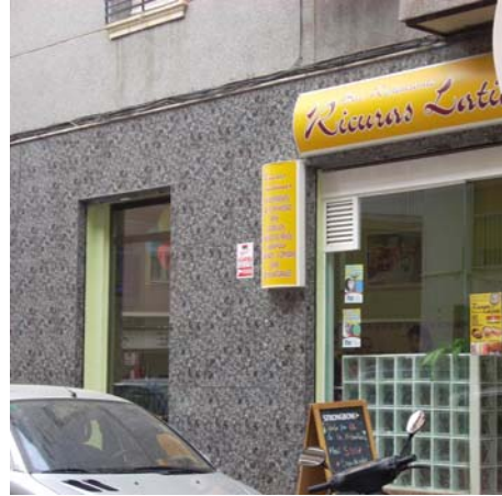
Foto 3: Restaurante latinoamericano en la calle Olegario Domarco Seller.

Estos territorios de marcada heterogeneidad étnica al ser identificados como nichos propensos para la formación de guetos son destinatarios de permanentes programas de trabajo social e investigación, que se sirven de los espacios públicos como escenarios de sensibilización y convivencia para mitigar el rechazo de la población autóctona ante los inmigrantes. Algunos son abanderados por la administración municipal y otros se desarrollan a iniciativa de alguna de las dieciséis asociaciones de inmigrantes de distintas nacionalidades que operan en la ciudad, la fortaleza del asociacionismo en la ciudad ha sido uno de los factores que ha favorecido la integración.