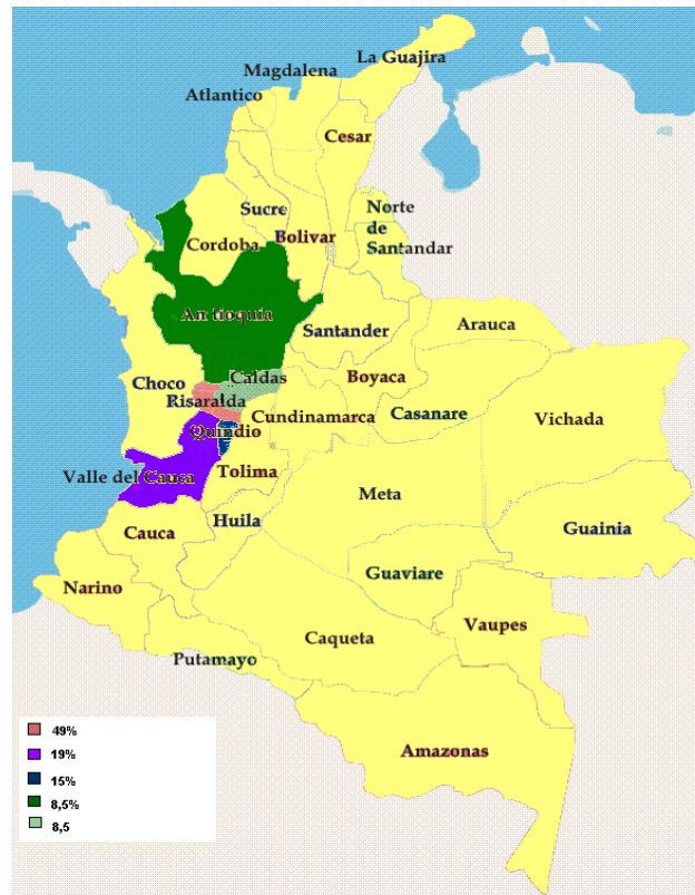
Grafico 1: Colombia departamentos de origen de los migrantes.

La población colombiana de Elche proviene principalmente del Eje Cafetero (72,5%) y especialmente de sus capitales departamentales, Pereira (28%), Armenia (15%) y Manizales (8,5%). El Valle del Cauca también aporta un amplio número de sus oriundos (19%), gran parte de ellos procedentes de su capital (15%), aunque también participan los municipios de Tulúa y Buga. Medellín es la ciudad que aporta el 8,5% restante.