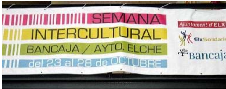
Foto 5: Valla en Plaza Primero de Mayo, en el marco del evento “El mundo en tu plaza, Carrús se mueve”.

Los colectivos de inmigrantes liderados por las asociaciones en que se organizan, no sólo ocupan la ciudad para su quehacer cotidiano, la celebración de sus fiestas patrias se recrea ya de manera habitual en algunos de los más insignes espacios públicos del municipio, así como las celebraciones típicas de la navidad, año nuevo entre otras; estas tienen lugar en varias zonas de la ciudad, especialmente en las plazas que hacen parte del distrito tres. Entre las diferentes nacionalidades de la ciudad son los sudamericanos los que más se ocupan en éste tipo de actividades, realizando también campeonatos deportivos entre equipos de diferentes procedencias.