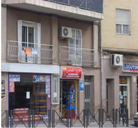
Foto 2: Calle José Bernard Amorós, locutorio y carnicería musulmana.