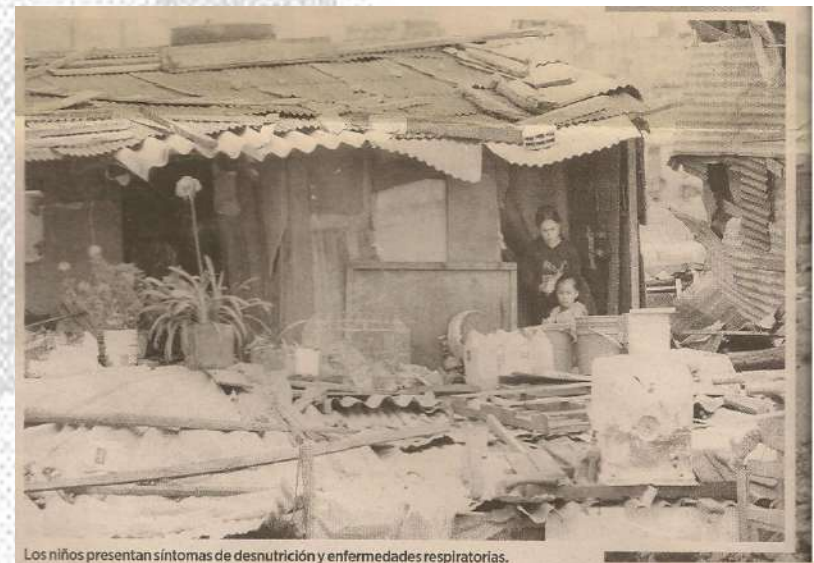
Los niños presentan síntomas de desnutrición y enfermedades respiratorias.

Explicar los fenómenos urbanos actuales desde la investigación de la vivienda informal y barrios informales, implica vincular principios teóricos de diferentes disciplinas, como son la acción colectiva, la participación, el derecho a la ciudad, la participación comunitaria, la organización comunitaria y la producción social del hábitat.