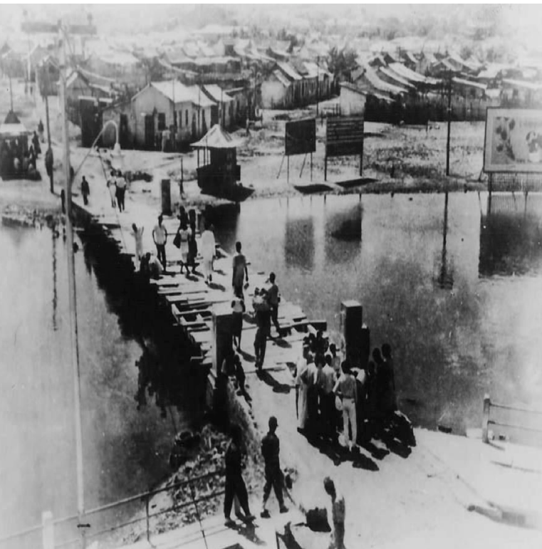
Acceso barrio Chambacú.

Desalojos. Visión Higienista. Haussman: recuperación del espacio como sinónimo de limpieza y modernidad.