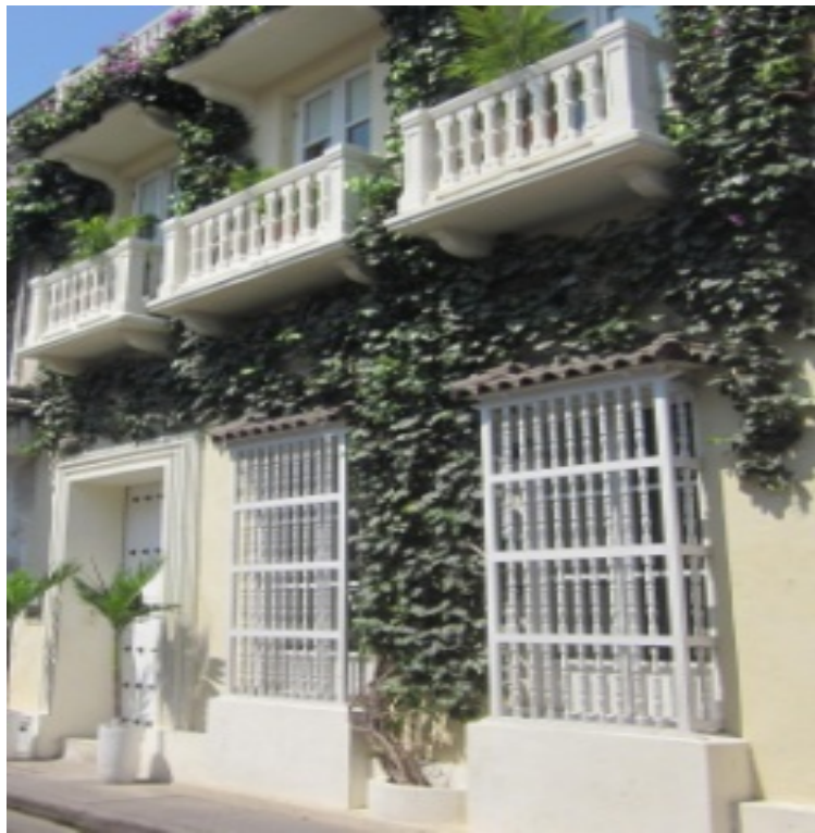
Calle El Guerrero

-Tensiones entre actores que ingresan y residentes tradicionales.