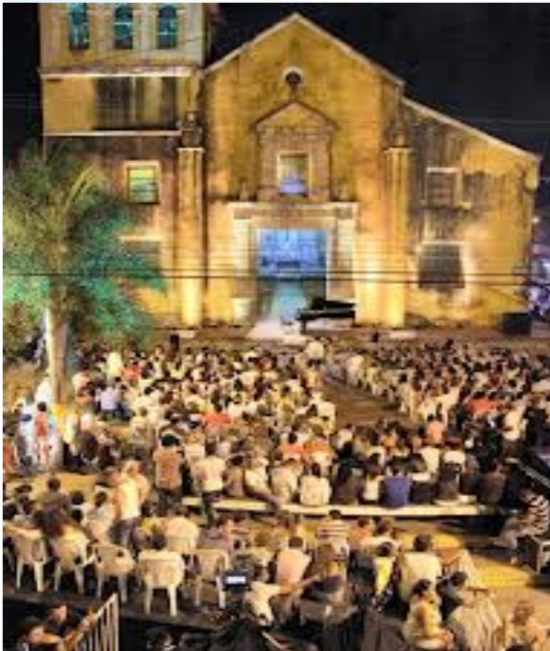
Festival Internacional de Música Plaza de la Trinidad.

Tipologías arquitectónicas (Pasajes, Accesorias). Espacios comunales-solidaridad vecinal.