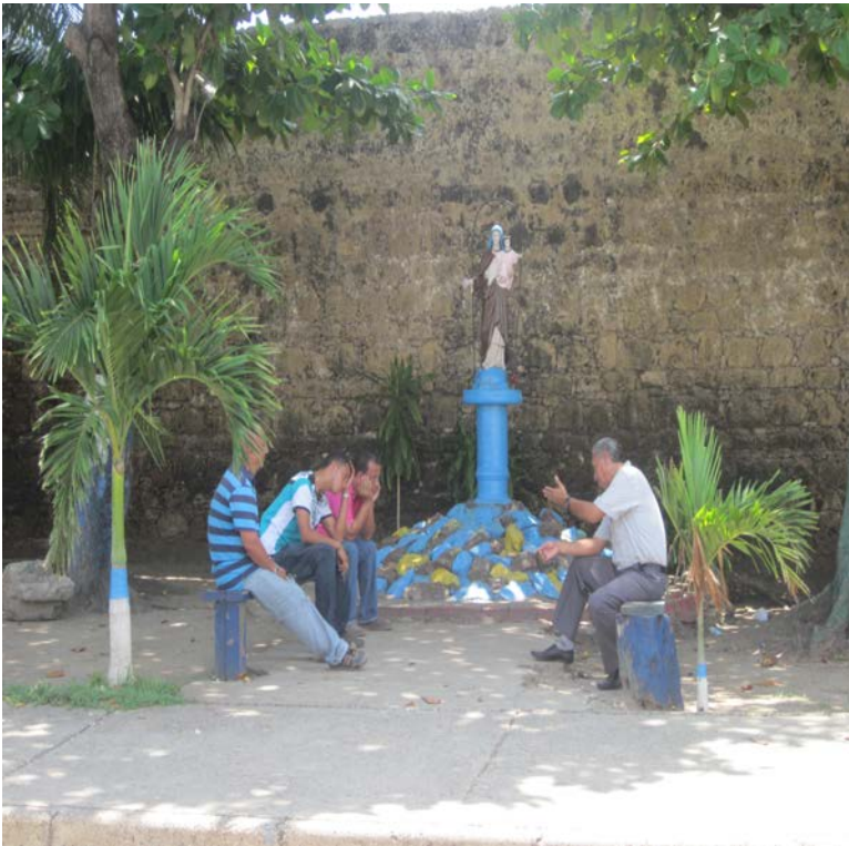
Muralla de El Pedregal.

“Antes el pasaje donde vivo, el Mebarak, estaba mejor. Éramos tan unidos con los vecinos que pintábamos las casas del mismo color y el 24 de diciembre hacíamos sancocho para todos. Era gente buena, pero todos fueron mudándose.” (E6, residente).