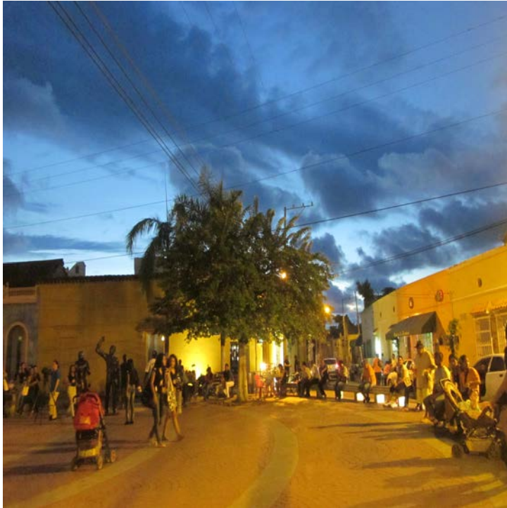
Plaza de la Trinidad

Precedido de significativo desplazamiento poblacional en las últimas décadas el centro histórico de Cartagena de Indias ha mutado el paisaje urbano, con irrupción de actores privados y variación en los usos del suelo; de manera más reciente pero intensificada el barrio Getsemaní recrea estos fenómenos sociales, suscitándose tensiones entre residentes y nuevos actores que generan formas de resistencia vecinal.