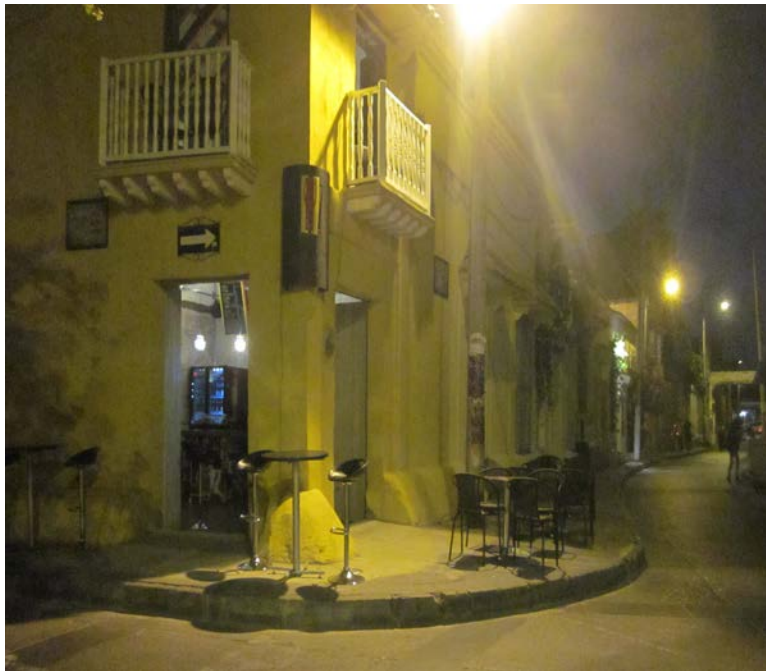
Calle la Sierpe, Getsemaní.

Ciudades latinoamericanas: procesos de resistencia a la gentrificación . Contra-gentrificación ó de-gentrificación . (Casgrain, Janoschka 2013).