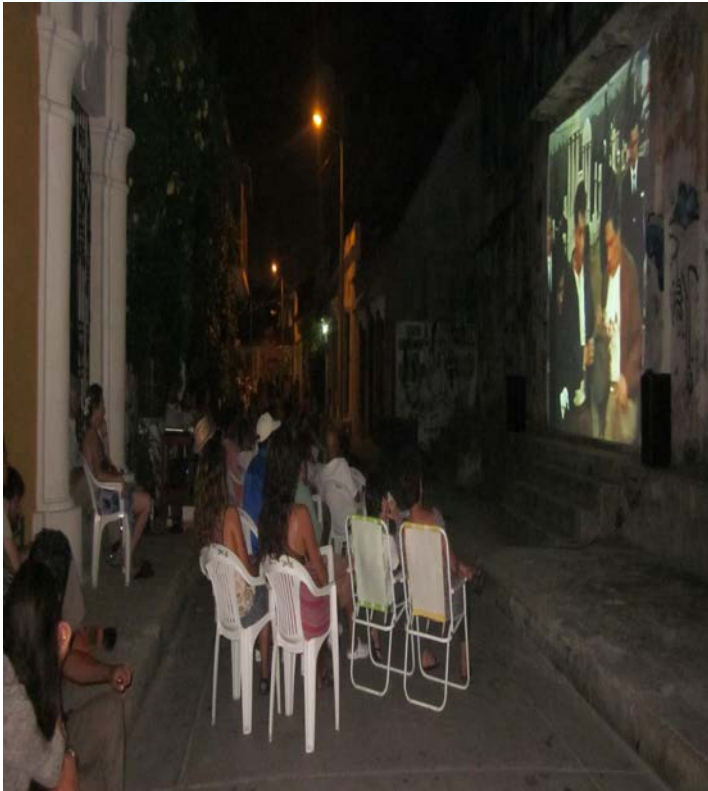
Getcinema, calle del barrio.