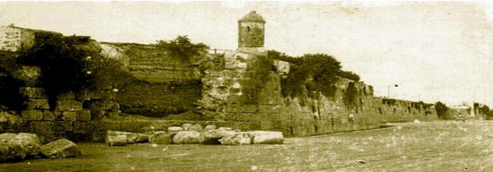
Baluartes San Andrés y San Pablo (demolidos).

“Las murallas fueron invadidas por la maleza, se convirtieron en basurero, letrina pública, amenaza para la salud y cerco opresor para la movilidad de quienes querían salir a extramuros.” “A tumbar se dijo” (columna de opinión). Periódico “El Universal”, edición del 19-05-13.