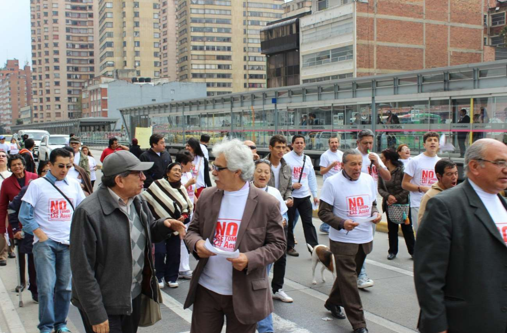
Movilización. No se Tomen las Aguas. (Fotografía: Carolina Urbina. 2013)