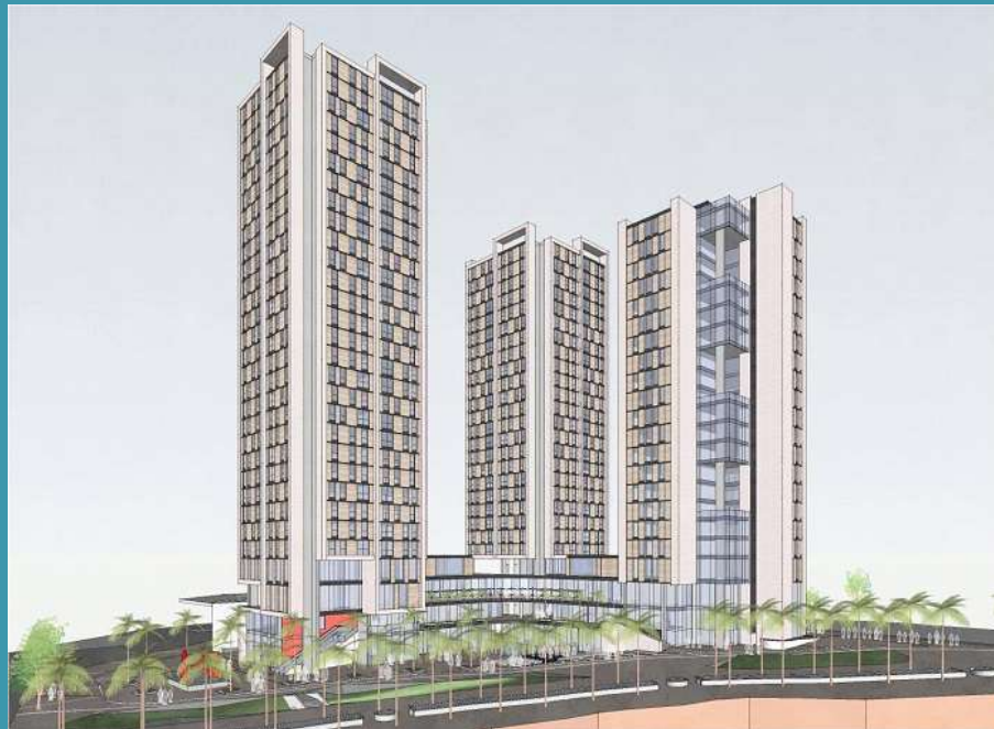
Proyecto City U- U. Andes