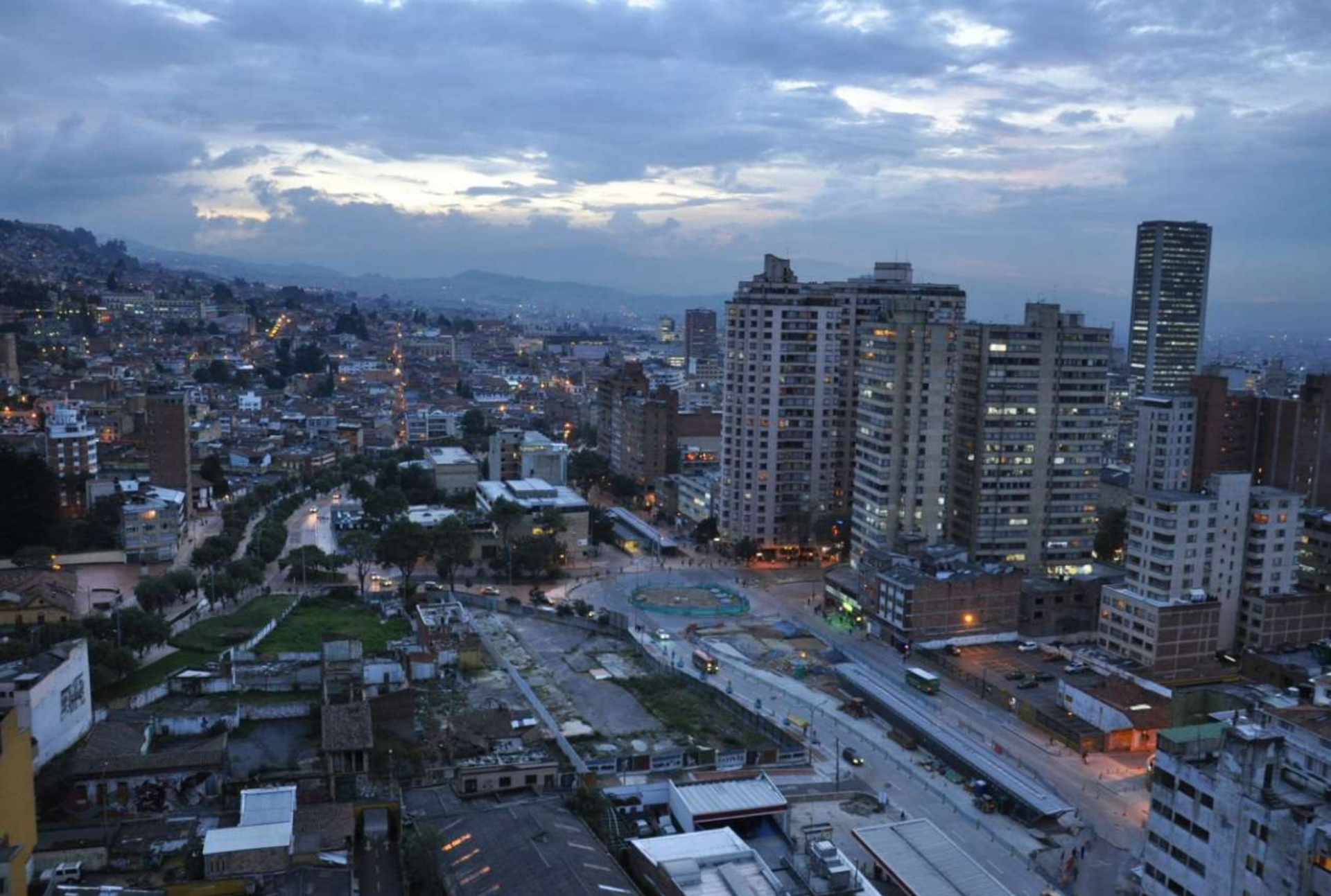
Barrio Las Aguas. Mananza. 5