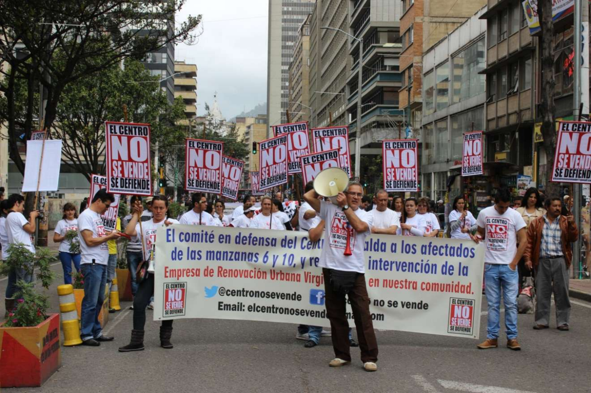
Movilización. El Centro no se vende. Carrera 7ª (Fotografía: Carolina Urbina, 2013).