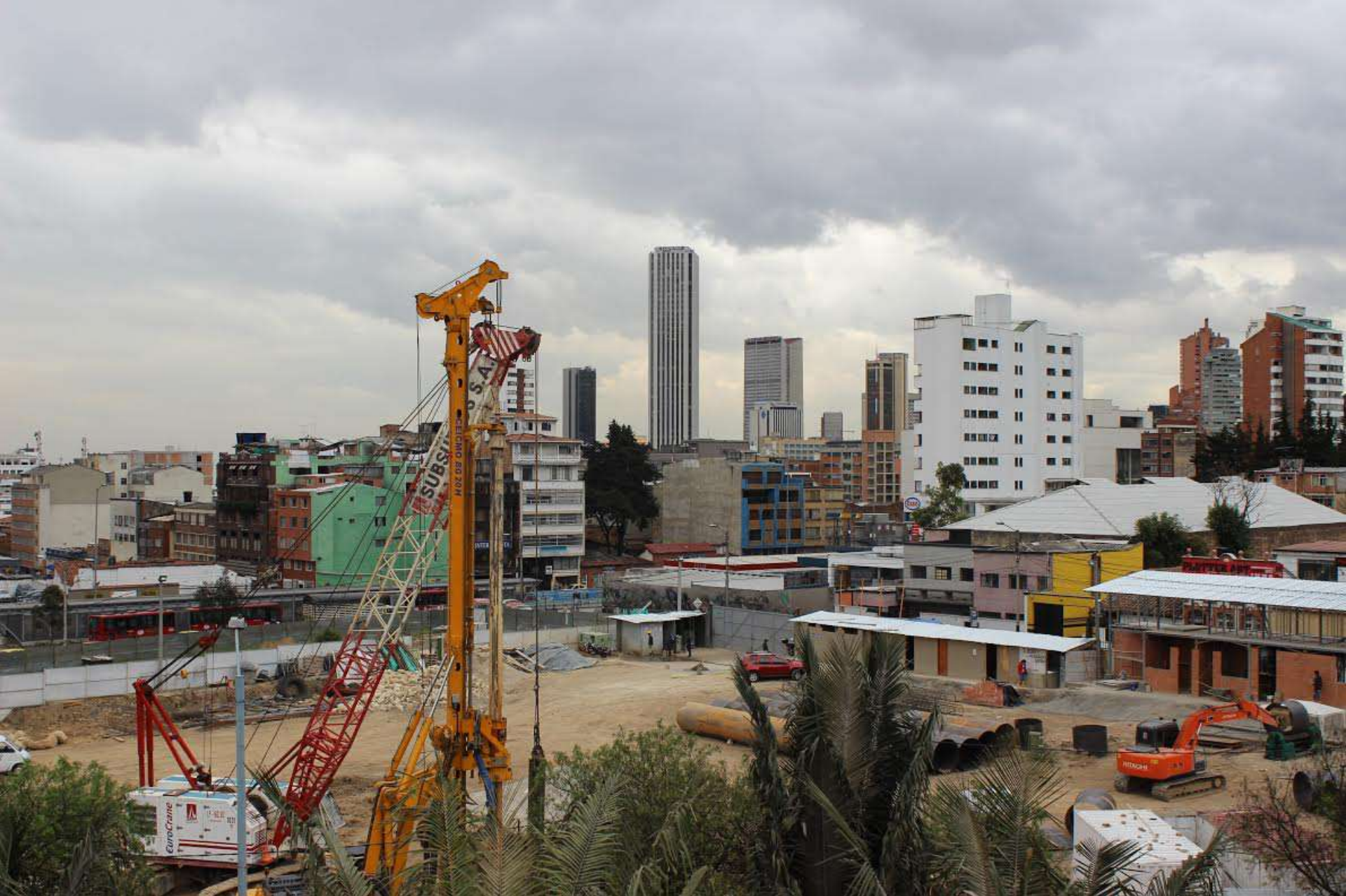
Barrio Las Aguas. Manzana 5