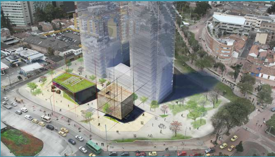
Nueva Cinemateca Distrital